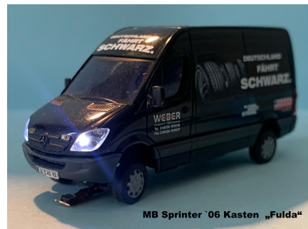
MB Sprinter '06 Kasten „Fulda“