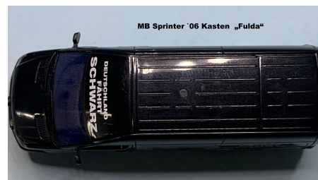
MB Sprinter '06 Kasten „Fulda“