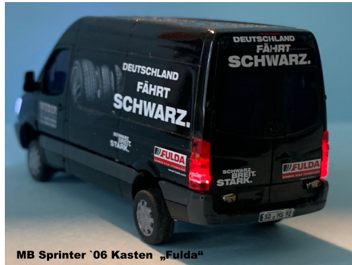
MB Sprinter '06 Kasten „Fulda“