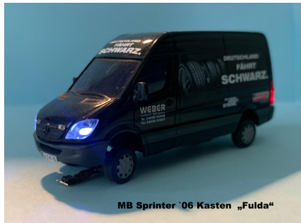
MB Sprinter '06 Kasten „Fulda“