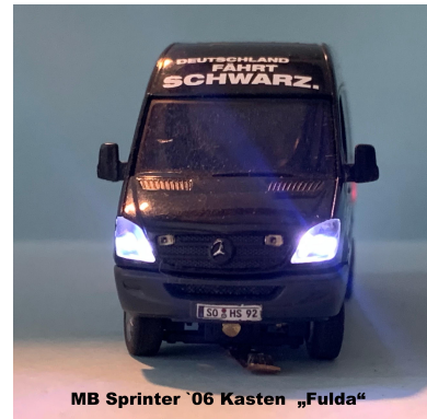
MB Sprinter '06 Kasten „Fulda“