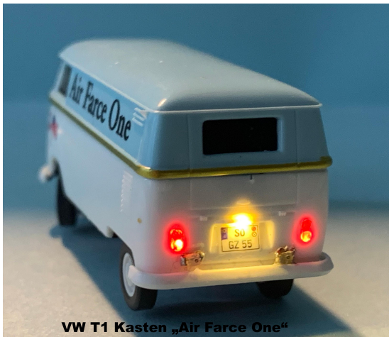
VW T1 Kasten „Air Farce One“