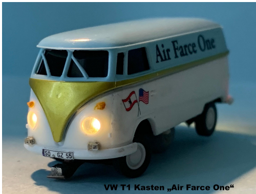
VW T1 Kasten „Air Farce One“