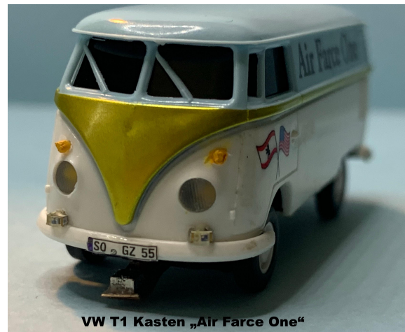
VW T1 Kasten „Air Farce One“