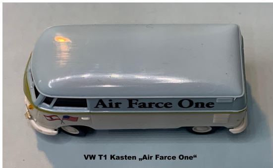
VW T1 Kasten „Air Farce One“