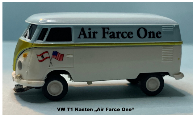
VW T1 Kasten „Air Farce One“